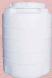
300 Liter ارتفاع ۱۰۱ عرض قطر ۶۹