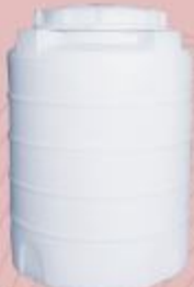
200 Liter ارتفاع ۲۳.۵ عرض قطر ۵۶