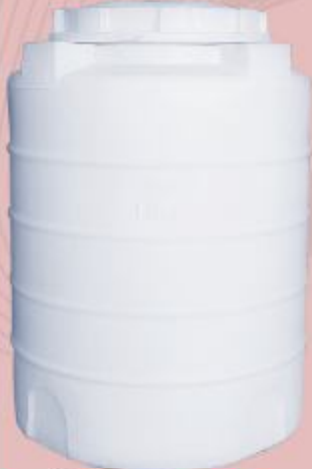
1000 Liter ارتفاع ۱۳۶ عرض قطر ۱۰۴.۵