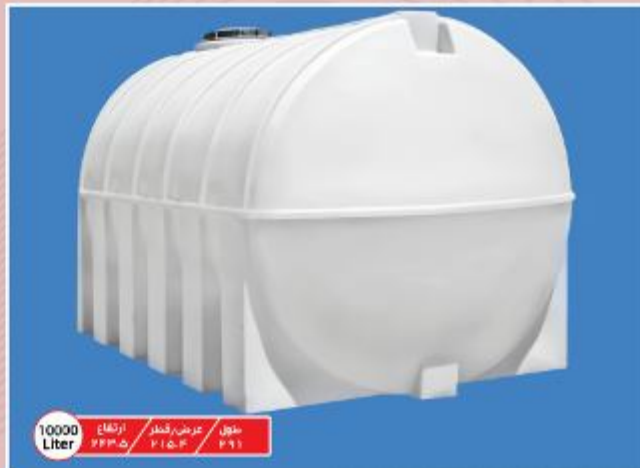
10000 Liter ارتفاع ۶۳۳.۵ عرض قطر ۲۱۵.۴ طول ۶۲۱